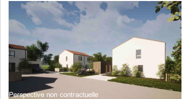
Perspective non contractuelle