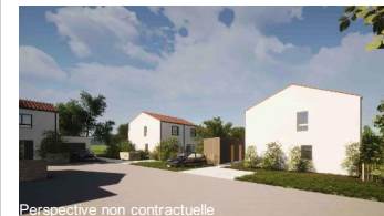
Perspective non contractuelle