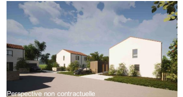
Perspective non contractuelle