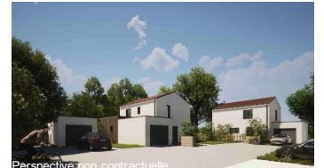
Perspective non contractuelle