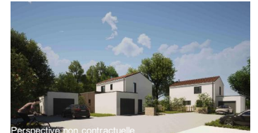
Perspective non contractuelle